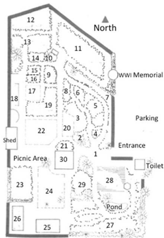
Washington Native Plant Society Garden

Western Washington Fruit Research Foundation Orchard